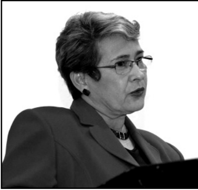
YAMILETH GONZÁLEZ GARCÍA, RECTORA DE LA UCR

Discurso pronunciado en la inauguración de la Exposición “La presencia de las mujeres en el Arte” el 24 de agosto 2009 en el marco del X Aniversario del CIEM.