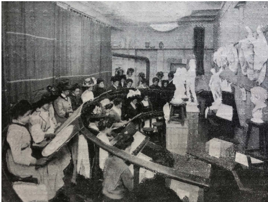
Figura 1, Fotografía de la clase de Dibujo y pintura aplicados a las labores de la mujer. Autoría desconocida. Fuente: Anuario de la Universidad de Barcelona, 1910, p.373.

Se conserva una fotografía de la clase de García, tomada hacia 1909 (Figura 1). Lamentablemente, ningún indicio nos permite reconocerla a ella ni a los otros dos profesores. Las estudiantes están distribuidas en dos gradas semicirculares, ocupando una sección de lo que parece un local más amplio, con una cortina separándolas del resto del espacio, quizá ocupado por varones o con elementos considerados inapropiados para su educación. En términos generales, la indumentaria de las alumnas es de clase acomodada. Parecen estar tomando apuntes de alguna de las estatuas en yeso colocadas frente a ellas, en peanas o fijadas a la pared, las cuales no pueden ser identificadas con seguridad a causa de la poca definición de la imagen. Es de suponer que los materiales didácticos puestos a disposición de las alumnas no diferirían demasiado de lo usado en su primera época como docente, con toda probabilidad eran las mismas de la Escuela de Dibujo para Niñas y Adultas.