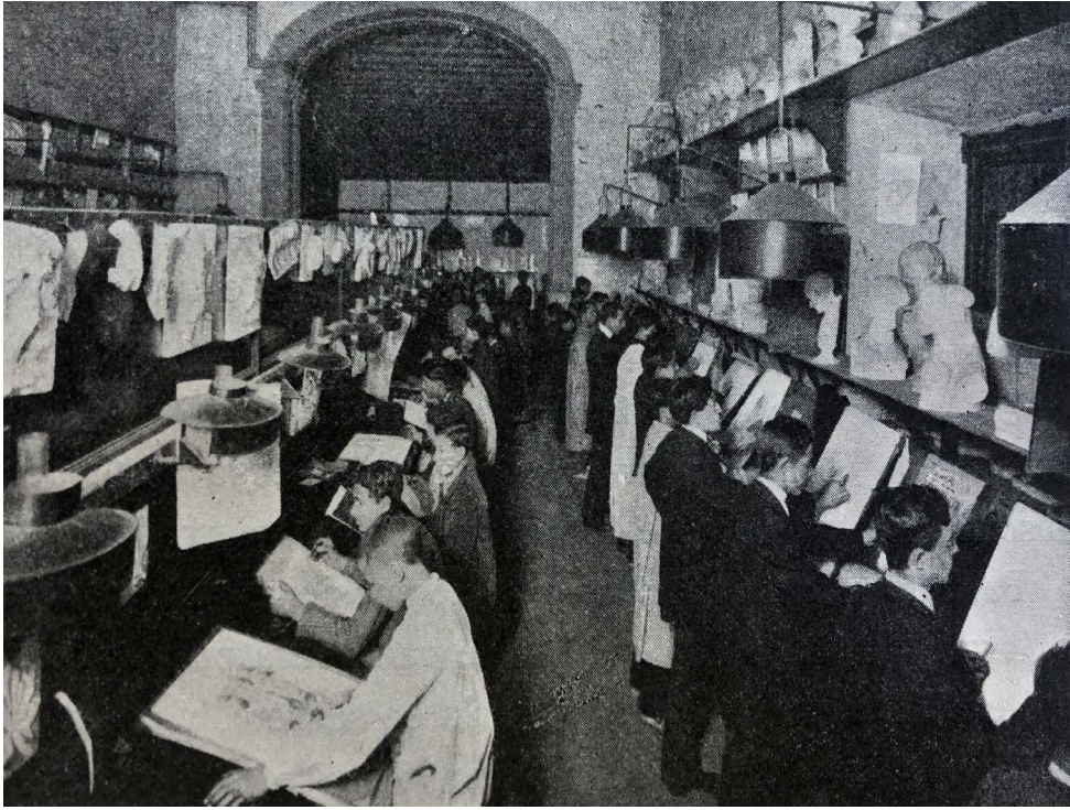
Figura 2, Fotografía de la "sección de señoritas" de la clase de Dibujo artístico, sede de la calle Aribau. Autoría desconocida. Fuente: Anuario de la Universidad de Barcelona, 1910, p. 455.

Sin embargo, fotografías tomadas en las aulas de la Escuela Superior de Artes y Oficios y Bellas Artes muestran cómo, alrededor de 1910, la presencia de alumnas en clases mixtas de todo tipo era ya un hecho (Figura 3). En términos generales, el volumen de matriculadas en toda la Escuela Superior de Artes y Oficios y Bellas Artes se incrementó considerablemente durante la primera década de siglo, pasando de 218 en 1906-1907, a 350 en 1910-1911, como demuestran los anuarios de la Universidad de Barcelona y los Estadísticos de la ciudad de Barcelona de esos años. Estos datos reflejan que la presencia de la mujer en los estudios artísticos oficiales era una realidad consolidada en la Barcelona de principios de siglo XX, constatándose además su clara preferencia por asignaturas menos aplicadas, con menos sesgo de género y más profesionalizadoras.