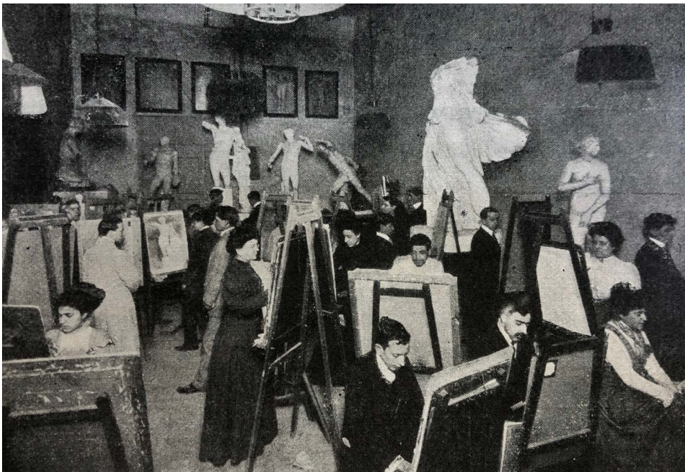
Figura 3, Fotografía de la clase de Dibujo del antiguo, sede central.

Sin embargo, fotografías tomadas en las aulas de la Escuela Superior de Artes y Oficios y Bellas Artes muestran cómo, alrededor de 1910, la presencia de alumnas en clases mixtas de todo tipo era ya un hecho (Figura 3). En términos generales, el volumen de matriculadas en toda la Escuela Superior de Artes y Oficios y Bellas Artes se incrementó considerablemente durante la primera década de siglo, pasando de 218 en 1906-1907, a 350 en 1910-1911, como demuestran los anuarios de la Universidad de Barcelona y los Estadísticos de la ciudad de Barcelona de esos años. Estos datos reflejan que la presencia de la mujer en los estudios artísticos oficiales era una realidad consolidada en la Barcelona de principios de siglo XX, constatándose además su clara preferencia por asignaturas menos aplicadas, con menos sesgo de género y más profesionalizadoras.