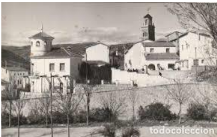
Fig.8 La localidad de Teresa en Castellón.