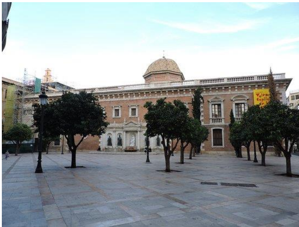
Fig. 1 La antigua Universidad de Valencia.