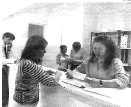
ENTRE LOS 35 Y 49 AÑOS SE DA LA MAYOR PROPORCIÓN DE TRABAJADORAS

Si en la sociedad moderna todo, o casi todo, se mide por el dinero y la capacidad de trabajo, no resulta un error afirmar que ahora el machismo está bien guardado en el placar. Una investigación de la consultora LatinPanel confirma que cada vez más las mujeres compiten con los hombres en el mercado laboral: en la Argentina ya suman el 46 por ciento las amas de casa mayores de 65 años que tra-